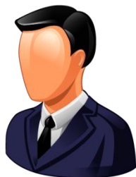
Владелец подвижного состава