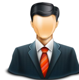
Владелец подъездных путей

Свободные подъездные пути грузоотправителя от подвижного состава, не имеющего грузовой базы